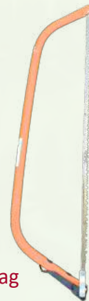
Handzaag / Beugelzaag