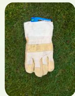
Handschoenen stevig model